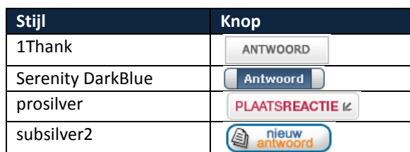
Tabel 2. Knoppen om te antwoorden in een bericht

Als u voor Antwoorden kiest, dan krijgt u een scherm dat gelijk is als het scherm waarin u nieuwe berichten plaatst. U ziet hierbij het bericht en de andere reacties niet.