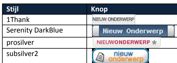
Tabel 1. Knoppen voor een nieuw onderwerp

Als u een nieuw bericht wilt plaatsen in een forum opent u het forum waarin u uw bericht wilt plaatsen. Daar klikt u op de knop “Nieuw onderwerp”.