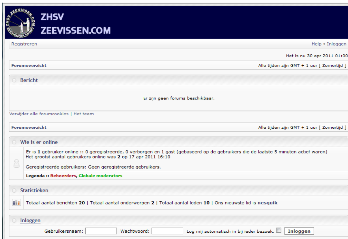
fig. 1. Openingscherm

Als u het forum opent krijgt u het volgende scherm te zien: