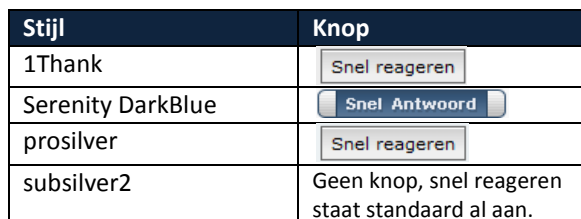
Tabel 3. Knoppen om snel te antwoorden in een bericht

Als u kiest voor snel antwoorden, wordt er een wat minder uitgebreid invoerschermje geopend onder aan de berichten. Hierin kunt een snel antwoord typen. Echter de knoppen voor de bbCode en smileys en het kleuren pallet wordt niet getoond. U kunt ze wel gebruiken, maar u zult ze dan zelf moeten typen in plaats van aan te klikken.